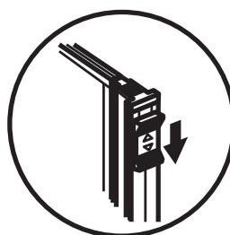
ストッパー解除状態

スライドパネル側面のストッパーを 上下共に解除すると、本体から抜くことができます。