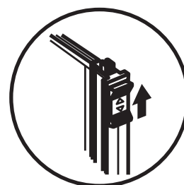
ストッパーロック状態